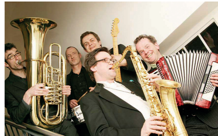
Die „Walking Blues Prophets“ aus Münster.

Für die Dauer des Westfälischen Ärztetages und des Sommerfestes bieten wir im Ärztehaus Münster kostenfrei eine qualifizierte Betreuung Ihrer Kinder von 3 bis 10 Jahren an. Falls Sie die Kinderbetreuung in Anspruch nehmen möchten, teilen Sie uns dies bitte zusammen mit Ihrer Anmeldung mit.