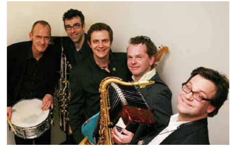
Die „Walking Blues Prophets“ aus Münster.

Für die Dauer des Westfälischen Ärztetages und des Sommerfestes bieten wir im Ärztehaus Münster kostenfrei eine qualifizierte Betreuung Ihrer Kinder von 3 bis 10 Jahren an. Falls Sie die Kinderbetreuung in Anspruch nehmen möchten, teilen Sie uns dies bitte zusammen mit Ihrer Anmeldung mit.